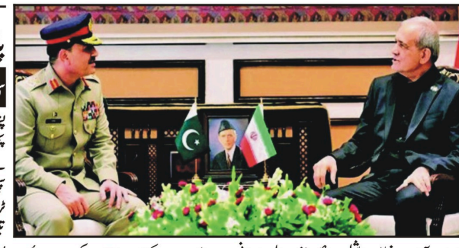
اسلام آباد: فیڈ مارشل عام منیر تال ایرانی صدر مسعود پڑھلیان ملاقات کر کے دیکھیں

پانچ لاکھ نوے لاکھ نقصان، سی این جی سپلائی وٹ بند کرنے کے فیصلے کی این جی سٹیٹس بند کرنے کے لیے ٹیکس ٹیٹ ڈاک سے پریشانی کی داسا مٹھراں ہو سکتا ہے۔