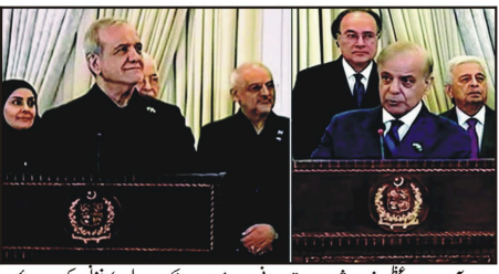
اسلام آباد: وزیر اعظم شہباز شریف نے ایرانی صدر مسعود پڑھلیان پریس کانفرنس کر کے دیکھیں

پانچ لاکھ نوے لاکھ نقصان، سی این جی سپلائی وٹ بند کرنے کے فیصلے کی این جی سٹیٹس بند کرنے کے لیے ٹیکس ٹیٹ ڈاک سے پریشانی کی داسا مٹھراں ہو سکتا ہے۔