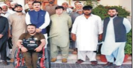
پٹور: گورنر خیبر پختونخوا فیصل کنڈی دے نال ہفتہ لیڈر شپ دے وفد دا گروپ فوٹو

پٹرول (دب ڈیب) چیمبر پرسن بی بی آئی ایس بی روینہہ خالد دالائیوی پچھری سیشن دا انعقاد۔