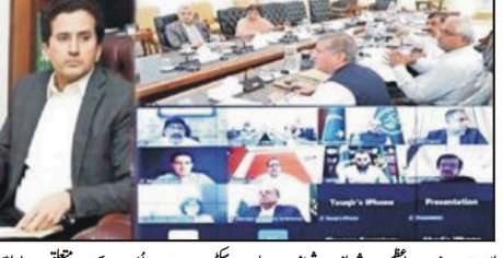
لاہور: وزیر اعظم شہباز شریف پاور سیکر کے امور سی متعلق اجلاس دی صدارت کر کے جین

مستند تے تعصب سی پاک غیر جانبدارانہ جرنل ای دخت تے اشاعت و نشریات ای اصل صحافت دی اساس اے۔