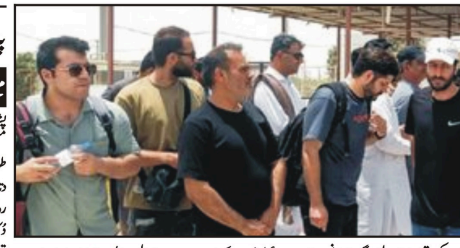
امریکی جے ایچ لے کے ایرانی جہاز پاکستان سے رستے میں واپس لایا گیا