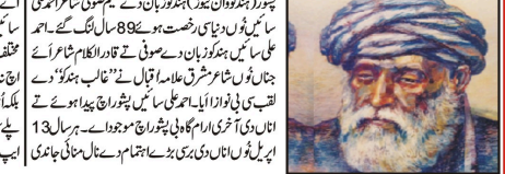
عظیم صوفی شاعر احمد علی سائیدی

پشور (ہندکوان ہفت روزہ) عظیم صوفی شاعر احمد علی سائیدی 89 ویں سال پھرنی