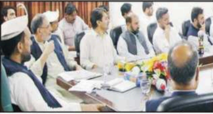
صوبائی وزیر کے اہل قلم کے ساتھ امریکی وزیر خارجہ ہنری بلینٹ کے وفد کے اراکین کی ملاقات۔