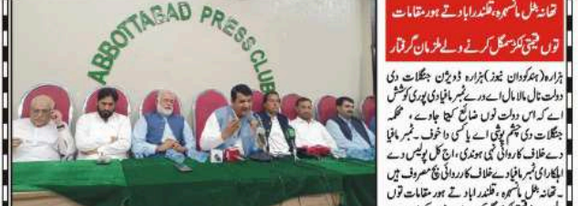
ہنڈکووان (بڈ ڈیک) ہنڈکووان تھوڑا تھوڑا توں کھنڈ کووان وے دوہڑاں وے آبادی دا تیزی نال دوہڑاں وے مسئلہ آبادی دا تیزی نال دوہڑاں وے ملک لیاقت وے اہم تقاضا وے خطاب...