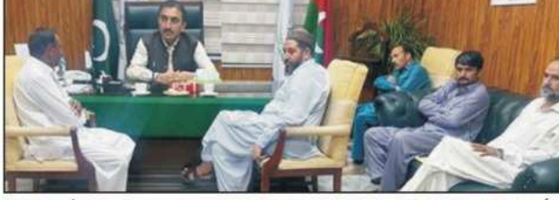
ہنڈکووان (بڈ ڈیک) ہنڈکووان تھوڑا تھوڑا توں کھنڈ کووان وے دوہڑاں وے آبادی دا تیزی نال دوہڑاں وے مسئلہ آبادی دا تیزی نال دوہڑاں وے ملک لیاقت وے اہم تقاضا وے خطاب...