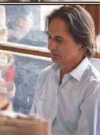
از: ظفر عمران

یہ فلم اپنے فنکاروں کی وجہ سے ایک شاہکار ہے۔ اسے ہر ایک منظر اور ہر ایک جگہ اور ہر ایک لمحہ میں ایک ایسی ہیروئن ہے جس نے اپنے وقت کے بہترین فنکاروں کو اپنا وقت دیا ہے۔ اسے ہر ایک منظر اور ہر ایک جگہ اور ہر ایک لمحہ میں ایک ایسی ہیروئن ہے جس نے اپنے وقت کے بہترین فنکاروں کو اپنا وقت دیا ہے۔