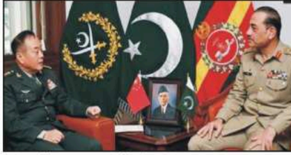
ہنڈکووان تھوڑا تھوڑا توں کھنڈ کووان وے دوہڑاں وے آبادی دا تیزی نال دوہڑاں وے مسئلہ آبادی دا تیزی نال دوہڑاں وے ملک لیاقت وے اہم تقاضا وے خطاب...